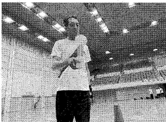
自社製品の「落下防止バー」を使ったボールリレー

社内運動会は、昨年10月31日に開催した。新型コロナウイルス感染症に伴う自粛がきっかけ。福利厚生の一環でスポーツジムの法人会員として社員に利用を促してきたが、昨春の緊急事態宣言で休業となったため社内運動会を企画し、その前準備として日頃からの運動の習慣づけに取り組むことになった。 同社は、社員が自主的に社内活性化に取り組む委員会制度を設けてい